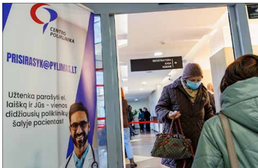
■ Na razie nie ma mowy o zakończeniu sezonu grypy