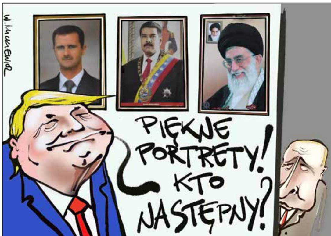
■ Rys. Władysław Mickiewicz