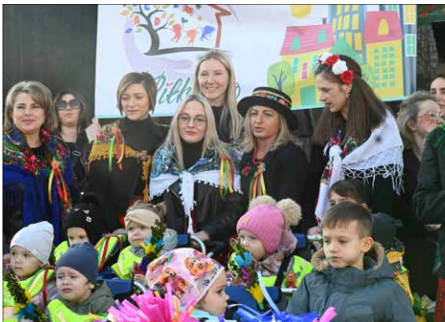
Ważnym elementem tegorocznych Kaziuków były występy dzieci i młodzieży