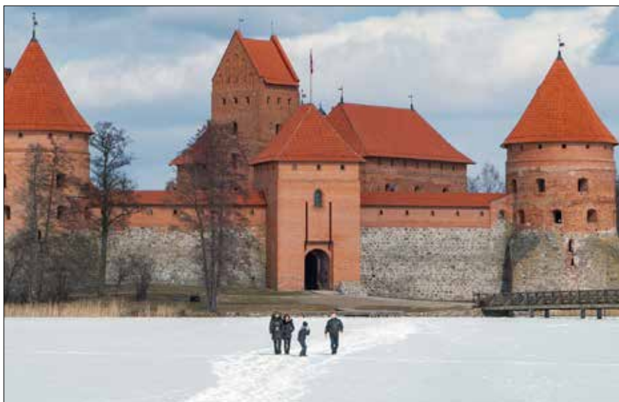
Dla jednej osoby stosunkowo bezpieczny jest lód o grubości 7-10 cm, natomiast dla grupy ludzi — od 12 cm

Trzeba szeroko opierać ręce o krawędź lodu, czołgać się poziomo i używać kolców. Po wydostaniu się nie należy wstawać od razu — bezpieczniej jest sturlać się lub przesunąć kilka metrów od przerębli, a dopiero potem wstać i wracać tą samą drogą. Po zdarzeniu należy jak najszybciej się ogrzać, zmienić mokre ubrania, a w przypadku drżenia, osłabienia, dezorientacji lub senności — wezwać pomoc. ■