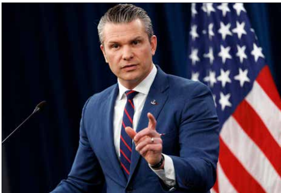
Amerykański minister wojny twierdzi, że „nie będzie żadnych ćwiczeń z wprowadzania demokracji”