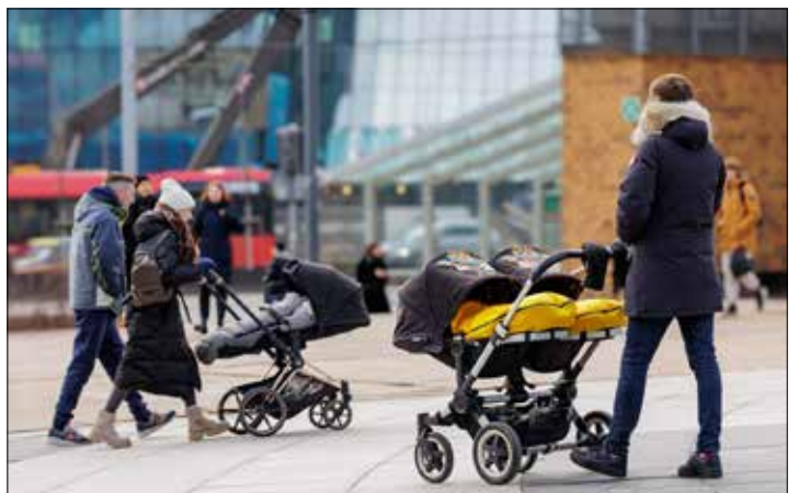
Pomysł zakłada przyznanie państwowej emerytury matkom lub ojcom, którzy wychowali troje lub więcej dzieci