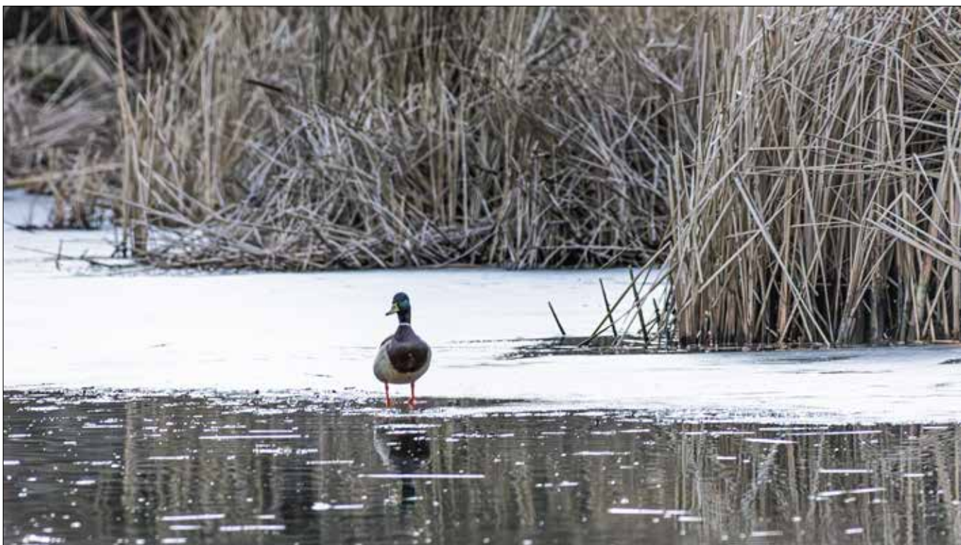
■ Zaczęły się roztopić...