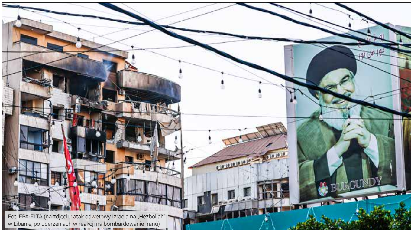
(na zdjęciu: atak odwetowy Izraela na „Hezbollah” w Libanie, po uderzeniach w reakcji na bombardowanie Iranu)

Amerykanie nie chcą „wprowadzać demokracji”