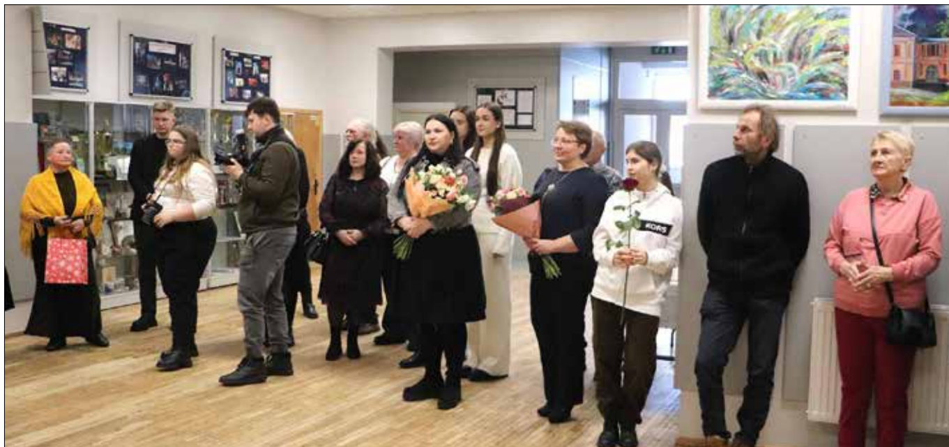
W wydarzeniu wzięli udział malarze, których obrazy zostały zaprezentowane na wystawie