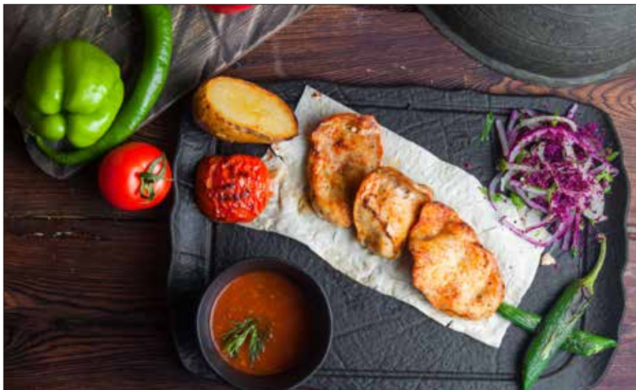
■ Fot. Freepik

Piersi z kurczaka oczyścić z błonek, przekroić wzdłuż na cieńsze płyty i delikatnie rozbić tłuczkiem przez