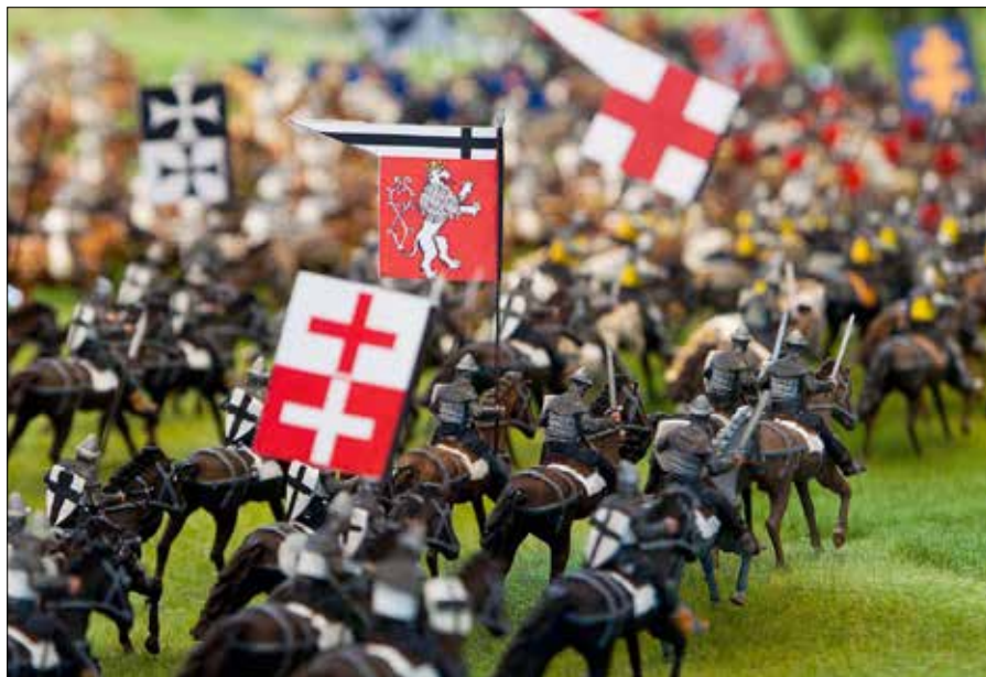
Konsekwencją koronacji Jagiełły było zwycięstwo polsko-litewskie pod Grunwaldem (na zdj. fragment makiety bitwy)