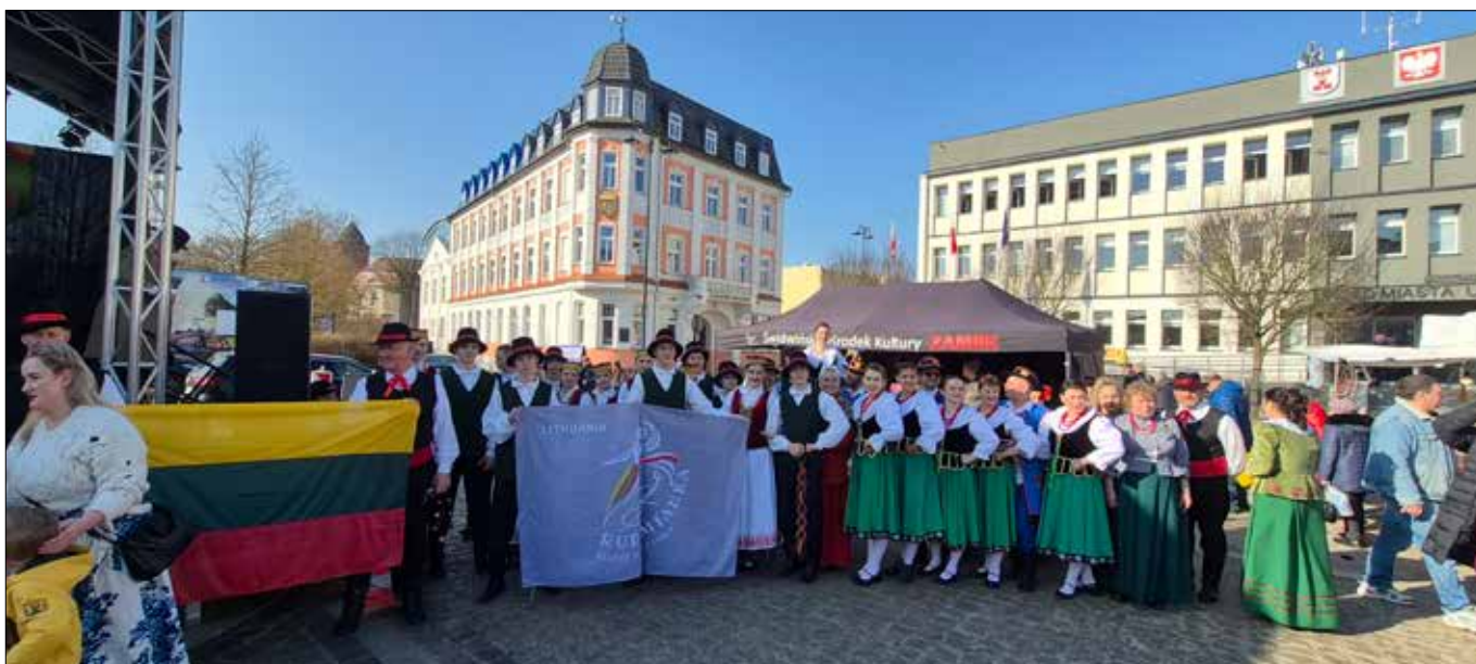
■ W dwa ostatnie dni lutego (27 i 28) Świdwin po raz kolejny stał się miejscem spotkania historii, tradycji i żywej kultury Kresów