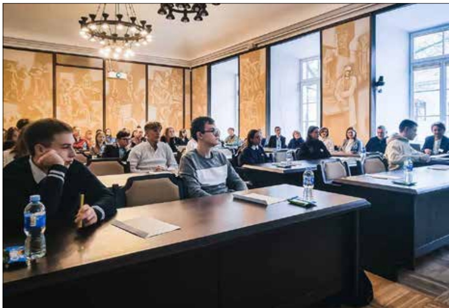
W części pisemnej olimpiady uczestniczyło 28 uczniów szkół polskich z Wilna i Wileńszczyzny