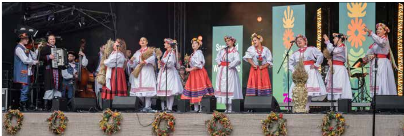
Ruszył nabór wniosków o dofinansowanie projektów kulturalnych w rejonie wileńskim – w 2026 roku samorząd przeznaczy na ich wsparcie 100 tys. euro

Stronę przygotowano na podstawie informacji Samorządu Rejonu Wileńskiego