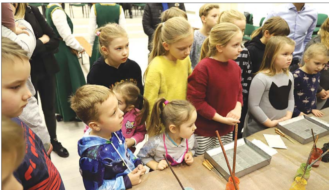
Z okazji święta narodowego najmłodszy rudomianie poznali nowe techniki malarstwa